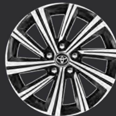
17" alufælge sort maskinpolerede (10-eget) Standard på Designpakken