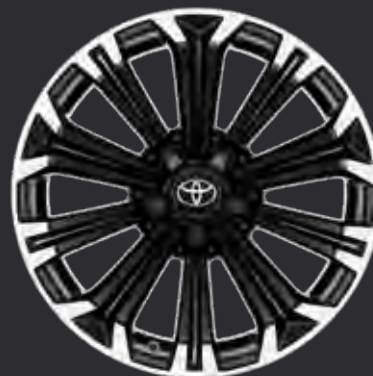
17" alufælge maskinpolerede (10-eget) Standard på GR SPORT