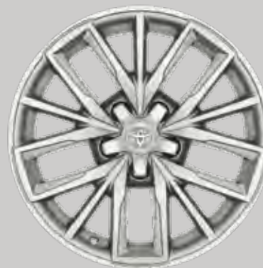
17" silver alufælge (5-triple-egget) Option til alle varianter