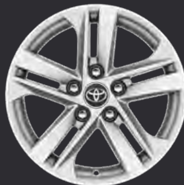
16" alufælge (5-dobbelt-eget) Standard på Active