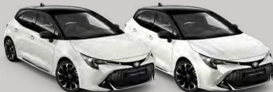
2PU Platinum Pearl White 2 /Night Sky Black 3