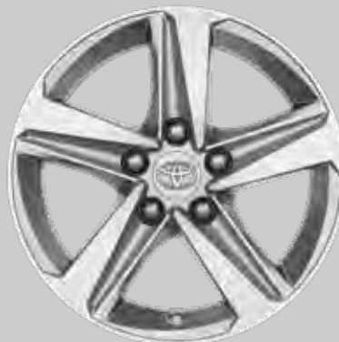
16" silver alufælge (5-egget) Option til alle varianter