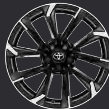
18" alufælge bi-tone black & maskinpolerede (5-eget) Standard på GR SPORT 2.0