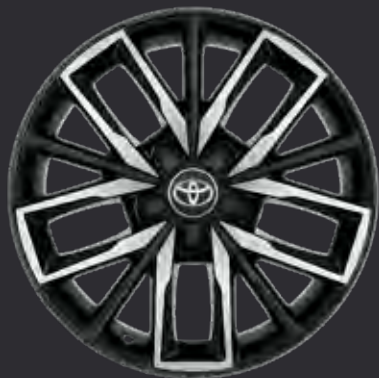
17" alufælge maskinpolerede (5-triple-egget) Standard på TREK