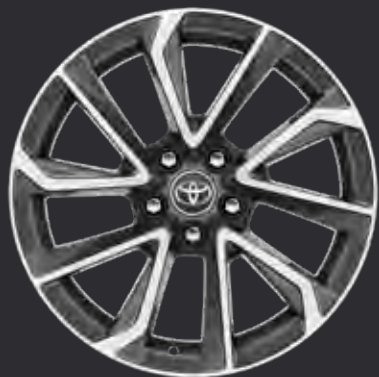
18" alufælge bi-tone grey maskinpolerede (5-egget) Standard på Elegant