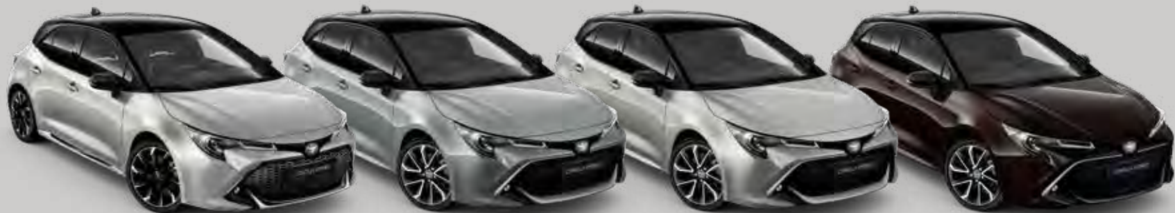
2TX Shimmering Silver 2 /Night Sky Black 3