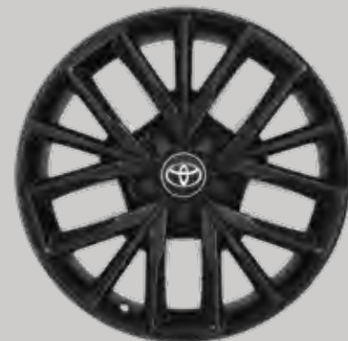
17" black alufælge (5-triple-egget) Option til alle varianter