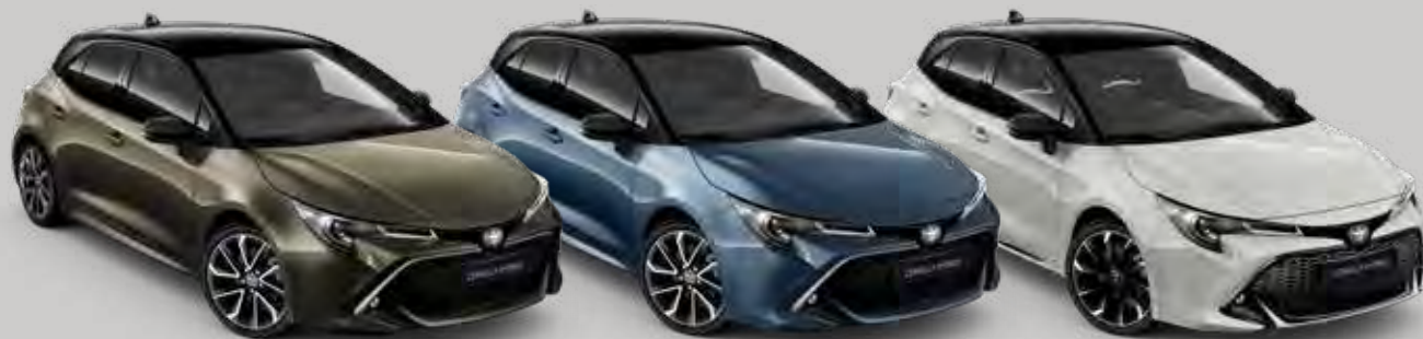
2RF Oxyde Bronze 2 /Night Sky Black 2,3,4