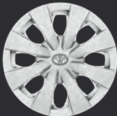
15" stålfælge med hjulkapsler (6-eget) Standard på Essential