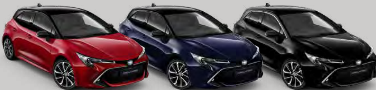
2SZ Flame Red 2 /Night Sky Black 2,3